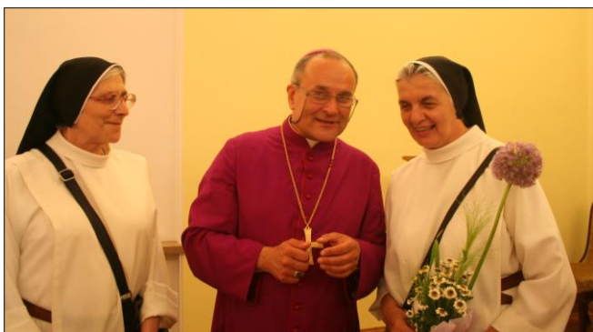
fot. Ks. Artur Sobótka. Biskup Michał Janocha w dniu otrzymania sakry biskupiej z Siostrami Dominikankami ze Słowacji.

tytuł magistra teologii. Po ukończeniu studiów, w 1983 roku wstąpił do Wyższego Metropolitalnego Seminarium Duchownego św. Jana Chrzciciela w Warszawie.